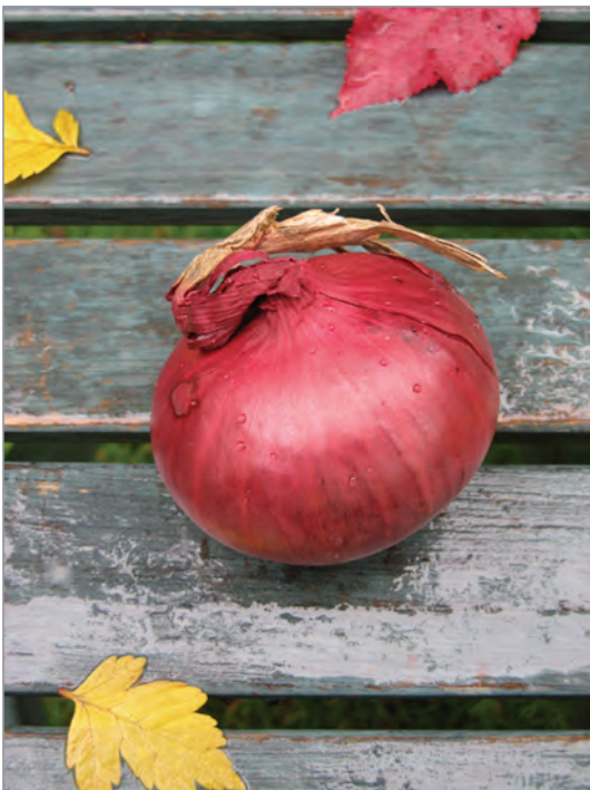
un oignon rouge